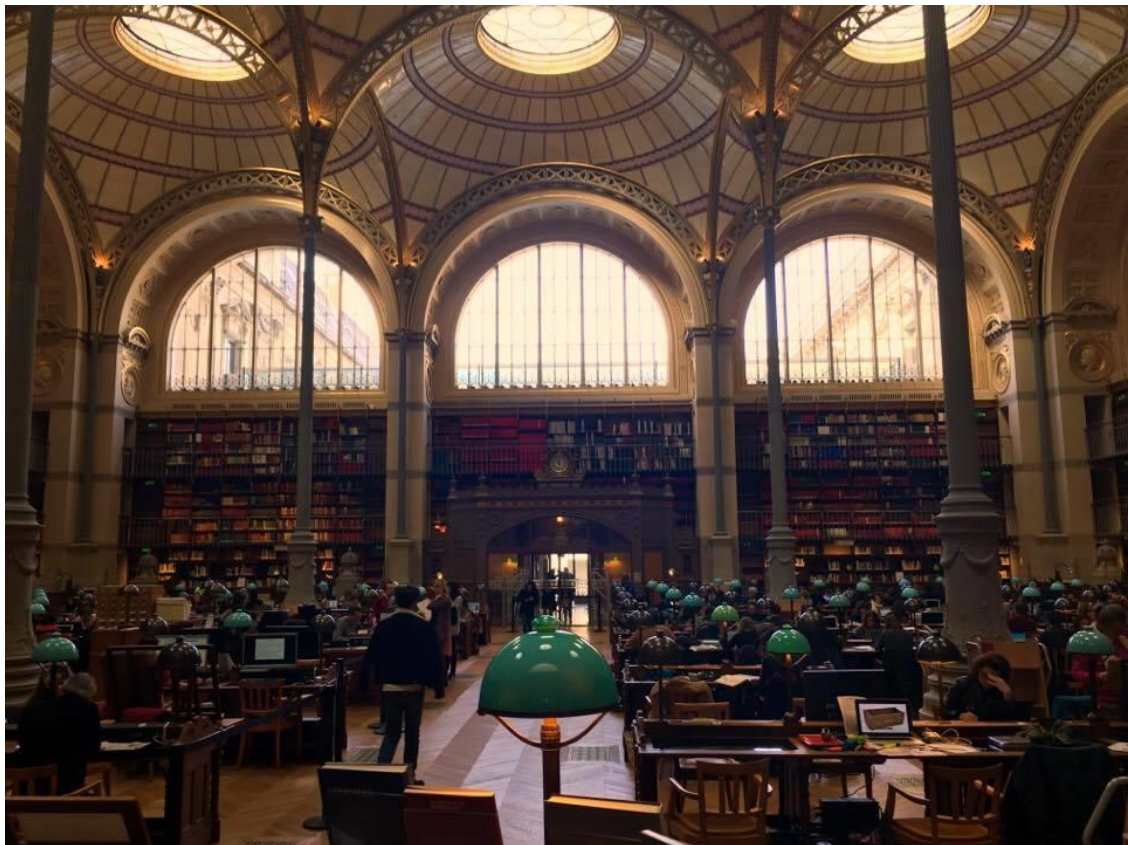
Salle Labrouste à la bibliothèque Richelieu

À la Révolution (1789 – 1799) ses fonds s'enrichissent considérablement grâce aux confiscations des biens du clergé et au départ de nombreux aristocrates et princes à l'étranger. Il n'est pas exagéré de dire que la Bibliothèque a doublé sa collection durant cette période, en tout ce sont 250 000 livres, 14 000 manuscrits et 80 025 estampes qui s'ajoutent à l'existant. Suite à cela, de nouvelles préoccupations font jour, comment stocker, conserver et communiquer le fonds documentaire ? C'est un enjeu sans précédent qui demande de vaste moyen. Le manque de place devient une préoccupation constante durant plusieurs décennies du XIX e siècle. Ce n'est que sous le Second Empire (1852 – 1870) que des modifications sont opérées. Les bâtiments existants sont agrandis et réaménagés par l'architecte Henri Labrouste (1801 - 1875) qui donne son nom à une des salles de lecture les plus célèbres de la Bibliothèque. De la fin du XIX e siècle jusqu'au XX e siècle, d'autres reconstructions et extensions sont réalisées, mais cela ne suffit pas à remédier aux problèmes récurrents de stockage et de manque de place pour les lecteurs.